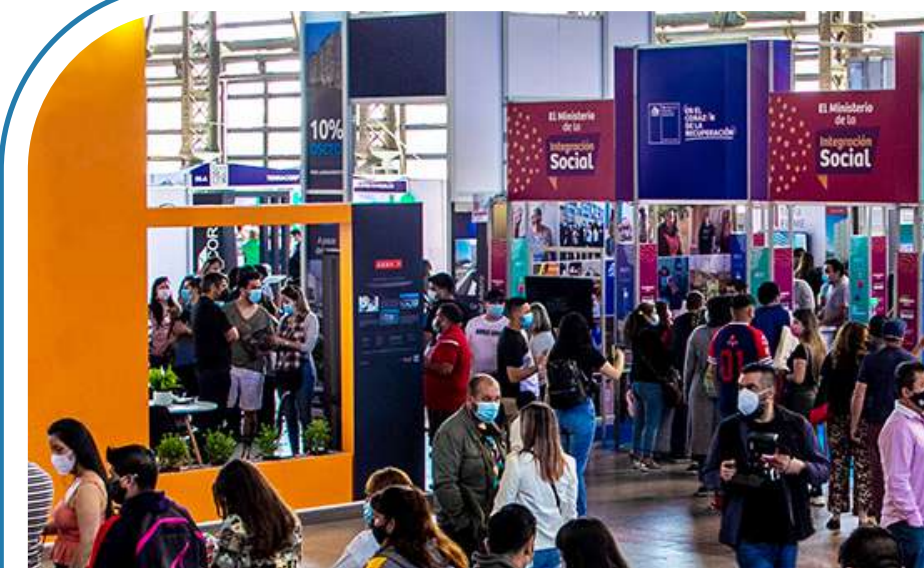
Imagen referencial proyectos expositores